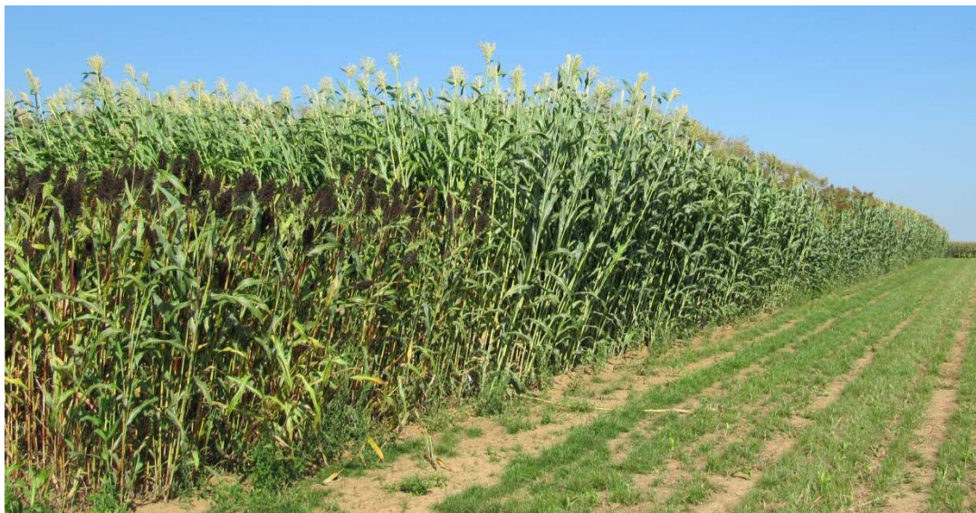
Abbildung 1: Blick entlang des Sorghum-Screenings, vorne links S. nigricans

Das bekannte Sorghum-Sortenscreening des TFZ umfasste in 2017 insgesamt 49 Sorten und Linien. Die Anbausaison 2017 war sehr günstig für Sorghum, der Sommer bot mit warmer Witterung und vielen Sonnenstunden beste Bedingungen für die Massebildung.