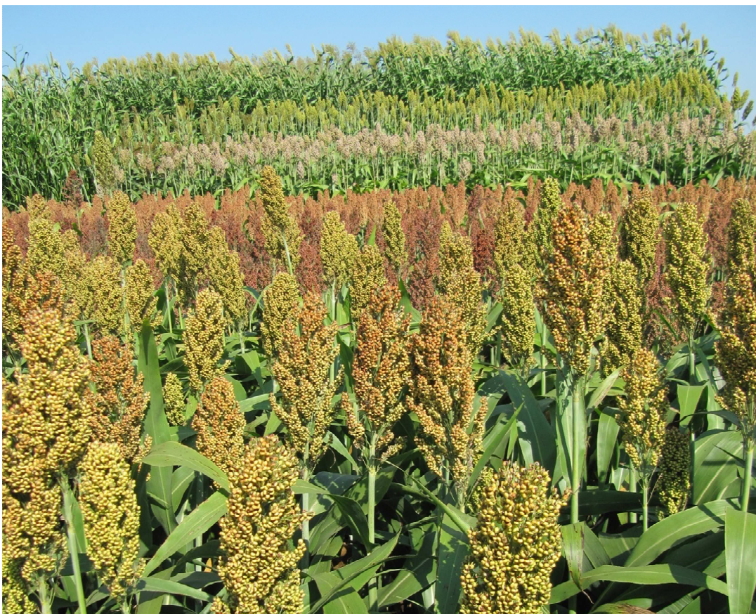
Abbildung 3: Blick über die erste Wiederholung des Körnersorghum-Screenings, im Hintergrund ein weiterer Sorghumversuch

Aufgrund der sehr günstigen Bedingungen standen die spätreifenden Maissorten sogar etwas kürzer im Feld als die frühreifenden Sorten. Der Referenzmais erzielte mit 201,5 bis 243,8 dt/ha sehr gute TM-Erträge, wobei Sorte Barros unerklärlicherweise etwas hinter den Erwartungen zurückblieb.